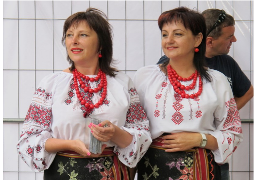
Ukrainische Folkloregruppe aus Lemberg

Abends schien es, als verspüre jeder Kurgast den Wunsch sich auf der Flaniermeile zu präsentieren. Entsprechendes Gedränge herrschte auf den öffentlichen Wegen. Eine ukrainische Folkloregruppe aus Lwów (Lemberg) sang, musizierte und tanzte mehrere Stunden vor unserem Hotel.