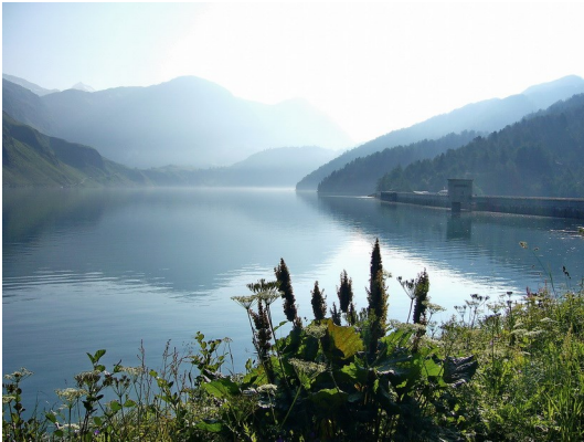
Lago Ritom am Morgen

Croce Portera 1917 m. Da gibt es eine Gaudi mit zwei Männern aus Bayern, die jedes Jahr eine Woche lang weitwandern und zwar Richtung Monaco. Ihr nächster Schlafplatz ist Acquacalda, gute Nacht.