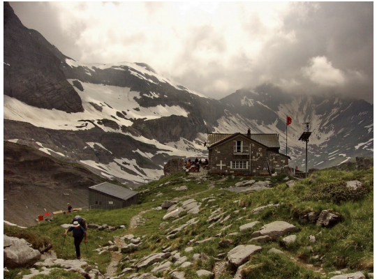
Cabane de Susanfe (2102 m) im Aufstieg zum Col de Susanfe (2494 m)

pass nach Rosswald, auf Höhe bleibend hinüber zum Simplonpass, über zwei leichte Pässe, dem Bistinepass und dem Gebidumpass, nach Gspon, auf Höhenwegen über Saas Fee nach Grächen. Der Balfrin-Höhenweg von Saas Fee nach Grächen hat als eine von gesamt zwei Etappen den Vermerk „Achtung: Trittsicherheit und Schwindelfreiheit erforderlich“, heikle Passagen sind abgesichert. Auf den weiteren dreizehn Etappen der Walliser Alpen ist es oft hochalpin mit Bergwegen über fast 3000 m hohe Pässe bei Tagesetappen mit bis zu 2165 Hm Aufstieg und bis zu 2420 Hm Abstieg, mit zwei Hüttenübernachtungen, mit einer Etappe für die Trittsicherheit und Schwindelfreiheit erforderlich sind. Es geht ab Grächen über den Augstbordpass nach Gruben, über den Meidpass nach Zinal, über den Col de Sorebis und Col de Torrent nach Arolla, weiter über Col de Riedmatten, Col de Prafleuri, Col de Louvie, Col du Bec d'Aigle, Tête du Sarshlau, Col des Otnes, Col de Mille nach Bourg-St-Pierre hinab, über Col du Grand St-Bernhard und Col du Bastillon nach La Fouly, über Champex und Trient nach Le Châtelard. Die Chablais Alpen folgen mit zwei Etappen über Col de Barberine, Col d'Emaney, Col de Susanfe und einer Hüttenübernachtung. Zum Ausklang geht es dann drei Etappen lang im Weideland mit dem weltweit größten Skigebiet „Portes du Soleil“ über Morgins und Tanay nach St-Gingolph am Genfer See, per Schiff nach Montreux und dann weiter zum Bahnhof.