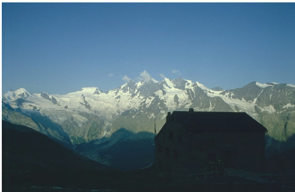
Schweizer Viertausender über Saas Fee