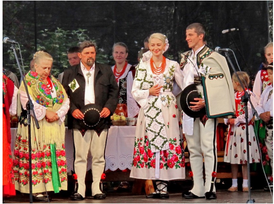
Goralen-Hochzeit auf dem Festivalgelände

Eine Goralen-Hochzeit wurde von Tänzern, Sängern und Hochzeitsgästen sehr euphorisch vor zahlreichem Publikum präsentiert. Die Gruppe "Wyrchowianie" stammte aus dem nahe gelegenen Ort Bukowina Tatrzajska. Lebensmittel- und Kunsthandwerkstände boten Spezialitäten und Volkskunst der Goralen an.