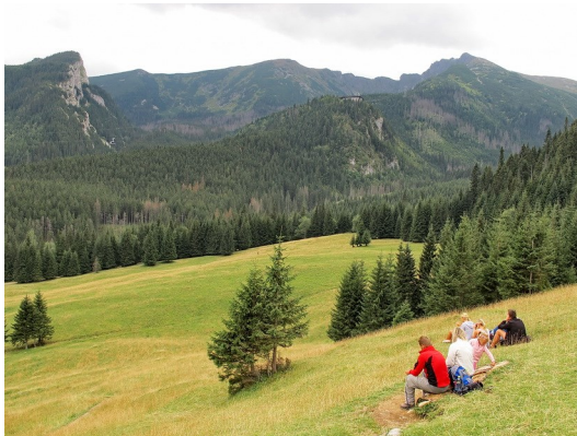
Blick von der Schronisko Górski Kalatówki auf die Gipfel der Hohen Tatra

Abends zogen wir durch die Fußgängerzone zum Festivalgelände und wurden durch Darbietungen von Tanz- und Musikgruppen aus 5 Nationen auf das Folklorefestival-Programm eingestimmt. Auf dem Festivalgelände sahen wir noch weitere Gruppen, überwiegend aus osteuropäischen Ländern, aber auch aus Kanada, Benin, der Mongolei und aus Indonesien. Gruppen aus dem Alpenraum waren nicht vertreten.