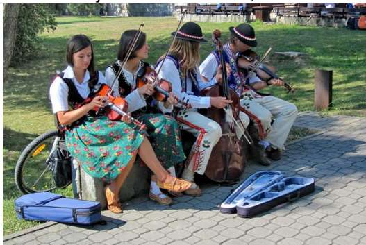
Junge Leute in Goralentracht am Ufer des Dunajetz

Das wahre Leben in Krościenko nad Dunajcem spielt sich am Fluss Dunajec (Dunajetz) ab. Ein Biergarten in der Nähe der Brücke und direkt am Ufer des Flusses lud uns zu einer Erfrischung ein. Mehrere polnische Flößer in Goralentracht kehrten von ihren Ausflugsfahrten zurück und verstauten ihre Flöße am Ufer. Die zahlreichen Fliegenfischer, die im Fluss Dunajec (Dunajetz) standen, inspirierten uns am Abend in dem Lokal „U Basi“ Fisch aus der Pieninen-Region zu essen.