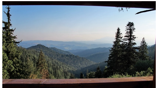
Blick nach Sonnenaufgang auf die Hohe Tatra

Am heutigen frühen Morgen hatten wir kurz nach Sonnenaufgang einen herrlichen Blick auf das Massiv der Hohen Tatra.