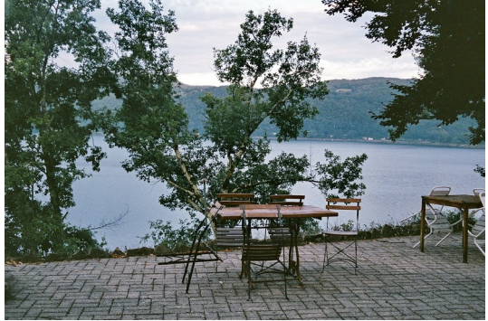
Blick über den Lac du Borget

Wanderer wäre die Beschreibung einfacher „über die Hauptstraße bis ... und dort der Markierung ... folgend“. Die Führung des Weges entlang von Gewerbegebieten, Schnellstraßen und einem Autobahnzubringer auf einem asphaltierten Radweg ohne Ausweichmöglichkeiten ist für den Wanderer nicht akzeptabel. Der Empfehlung, von Chambéry nach Le Bourget-du-Lac den Bus zunehmen, ist nichts hinzuzufügen. Auch auf dem Weiterweg bis Aix-les-Bains wird der Wanderweg über den asphaltierten Radweg geführt, dem man nur gelegentlich ausweichen kann. Der Wanderer wird auf seinem Weiterweg wenigstens mit Blick auf den größten natürlichen See in den französischen Alpen, dem „Lac du Bourget“ entschädigt. Insgesamt weist der gesamte Weg einen zu hohen Asphaltanteil aus.