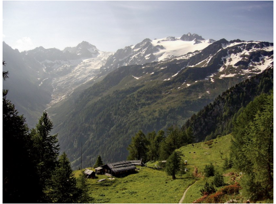
Blick auf die Walliser Gletscher

Wir entschließen uns zur Umfahrung der zwei Pässe. Also Abstieg ins Tal, mit Bus und Bahn nach Le Chatelard, schon sind wir wieder auf dem 6er und im Aufstieg zur Alpe Catogne 2011 m. Im Abstieg zum Dorf Trient haben wir einen Ausblick auf Walliser Gletscher. Für solche Bilder sind wir unterwegs, das sind die großen Momente auf allen Etappen des 6ers.