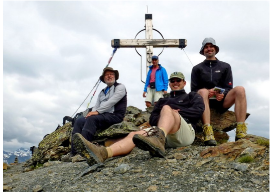
Auf dem Hinteren Brunnkogel

Nachdem wir uns ausgiebig am Frühstücksbuffet gelabt haben, brechen wir auf. Das erste Teilstück der heutigen Etappe ist eine Gratwanderung – der Erzherzog-Eugen-Weg – die uns in ständigem Auf und Ab über mehrere Gipfel führt: Vorderer Brunnkogel (2761 m), Hinterer Brunnkogel (2887 m), Rotkogel (2894 m), und Wilde Rötesspitze (2966 m). Der Grat ist nicht wirklich ausgesetzt aber hin und wieder mit Sicherungen versehen und ab und zu muss man auch mal die Hände zum Fortkommen benutzen; lediglich das letzte Stück bis zum Gipfel der Wilden Rötesspitze ist etwas schwieriger.