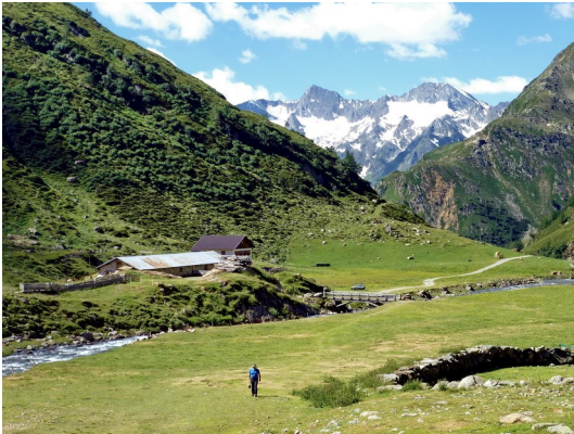
Auf der Timmelsalm

Aus Zeitgründen entschließen wir uns allerdings schweren Herzens, diese Etappe ausfallen zu lassen und direkt zur Siegerlandhütte zu gehen.