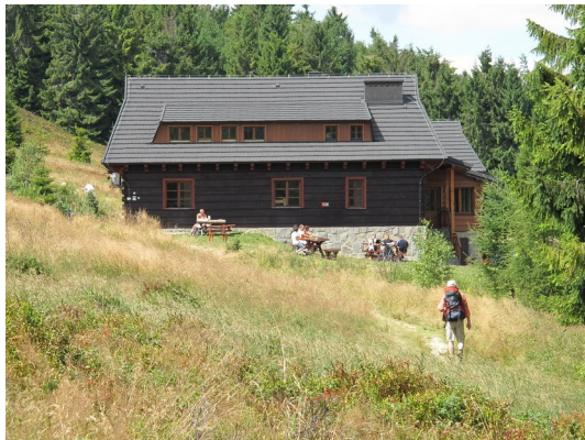
Berghütte Łabowaska Hala

Auf der Höhe war ein ideales Wanderwetter mit Temperaturen um die 20 Grad. Auf dem gut gekennzeichneten Weg erreichten wir nach 55 Minuten die Weggabelung Runek. Hier trafen wir heute zum ersten Mal auf mehrere Wanderer, die eine Frühstückspause einlegten.