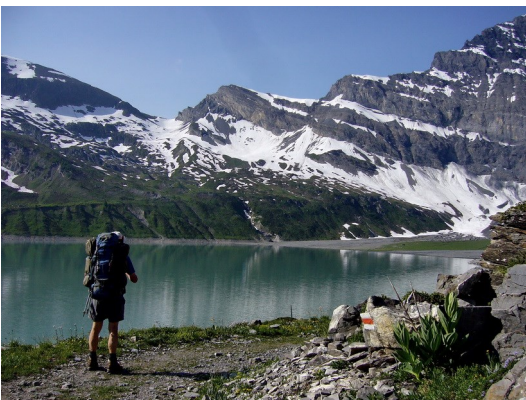
Col d'Emaney (2462m) über dem Lac de Salanfe (1942 m)

Unser Beginn auf der NR.6 geht ab Champéry 1030 m durch die Dents du Midi-Gruppe mit einem langen Aufstieg über die Cabane de Susanfe zum Col de Susanfe 2494 m mit einigen Schneefeldern. Der Abstieg nach Osten ist oben steil und voll Schnee. Großes Risiko, Lawinen gehen ab. Wir schaffen den Abstieg zum Lac de Salanfe, doch wie geht es weiter? Der Aufstieg zum Col d'Emaney 2462 m scheint machbar, doch dahinter kommen ein steiler Abstieg und ein weiterer Pass.