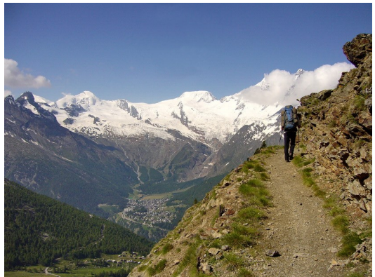
Blick nach Saas Fee vom Gspioner-Höhenweg

Schwupps mit der Seilbahn auffahren zum Kreuzboden 2400 m, und schon sind wir auf dem Höhenweg Richtung Gspion mit Ausblick auf die 4000er bei Saas Fee, grandios. Dazu der Blick auf den Balfrin-Höhenweg von gestern, nicht zu glauben, wie steil die Flanke mit dem waagrechten Steig ist. In neun Tagen Schönwetter, mit schönsten Aussichten von guten Wanderwegen in Wald- und Almlandschaft mit Blumenpracht, kommen wir über