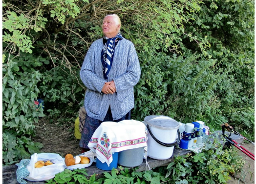
Auf dem Weg zum Gipfel verkauft eine Bäuerin Buttermilch

Zunächst geht der Weg ziemlich steil nach oben. An einer Abzweigung – jeder Wanderer muss an dieser Stelle vorbei – verkaufte eine Bäuerin selbstgemachte Buttermilch, Pflaumenkompott (mit sehr viel Flüssigkeit), geräucherten Schafskäse und geräucherten Ziegenkäse (Oszczypek).