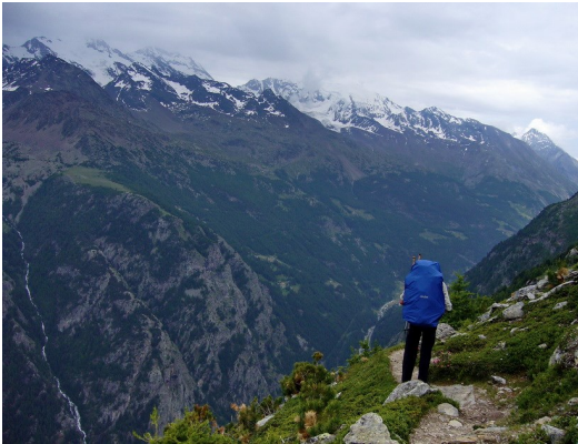
Blick vom Balfrin-Höhenweg ins Saastal

kommen uns viele Leute auf der Mont-Blanc-Umrandung entgegen, ein bunt gemischtes Volk. Die nächste Entscheidung steht an. Was erwartet uns an den zehn weiteren bis zu 3000 m hohen Pässen der Walliser Alpen? Wir kennen sieben dieser Pässe von meiner 2. Alpen-Längsüberschreitung, sie haben zum Teil steile Hänge. Das Schneeproblem verlangt die Umfahrung statt probieren und riskieren. Abstieg nach Orsieres, Fahrt mit Bahn und Bus über Martigny und Visp nach Grächen.