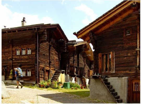
Im Dorf Münster im Goms

Der Weiterweg ist anfangs eine Tunnel-Baustelle. Zum Glück ist Sonntag, wir schlängeln uns durch und können gut den langen Weg über die nette Bortelhütte 2113 m nach Rosswald gehen. Hier testen wir mal das Massenlager des Hotels: nicht gut. Nach dem Safischpass 2563 m besuchen wir das urige Bergdorf Binn, bummeln durch die Twingischlucht ins Goms, dem oberen Rhonetal mit den historischen Dörfern Ernen, Mühlebach, Steinhaus, Niederwald, Reckingen, Münster und Ulrichen. Da gibt viel zu sehen an alter Baukultur und kostbarer Kirchengeschichte. Schon wird es wieder Ernst mit dem Aufstieg zum Griessee und dem Abstieg über die neu gestaltete Capanna Corno-Gries zum Zelten im Val Bedretto.