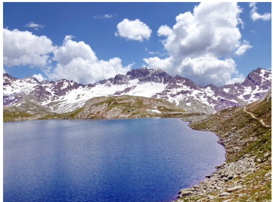
Der Große Timmler Schwarzsee

Nun senkt sich der Weg noch einmal etwas ab, um dann in einem kurzen furiosen Schlussanstieg hinter eine Biegung den Blick auf das grandiose Bergpanorama am Großen Timmler Schwarzsee (2514 m) freizugeben.