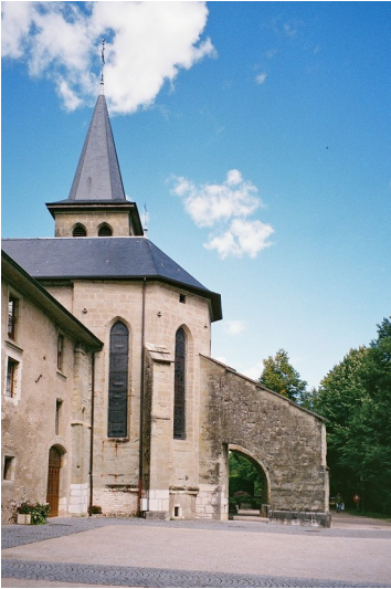
Le Bourget-du-Lac - Kloster der Mönche von Cluny

4 km außerhalb vom Hauptort. Der Umweg über die Autostraße lohnt sich. Die Villa verfügt über einen eigenen Badestrand und der Chef des Hauses lässt es sich nicht nehmen, dem einzigen Gast ein 4-Gänge-Menü mit Aperitif und Wein zu einem absolut akzeptablen Preis zu servieren! Beim Weiterweg weiche ich vom Sentier sur les pas des Huguenots ab.