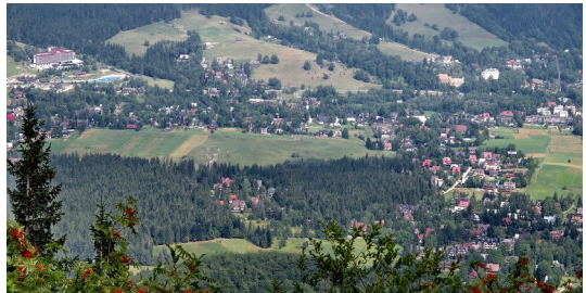
Blick vom Aussichtsfelsen Sarnia Skala auf Zakopane

Aber an diesem Tag war der Gipfel in Nebel gehüllt. Wir entschlossen uns am Ende des Tals, an der Hütte Strażyska Polana auf dem