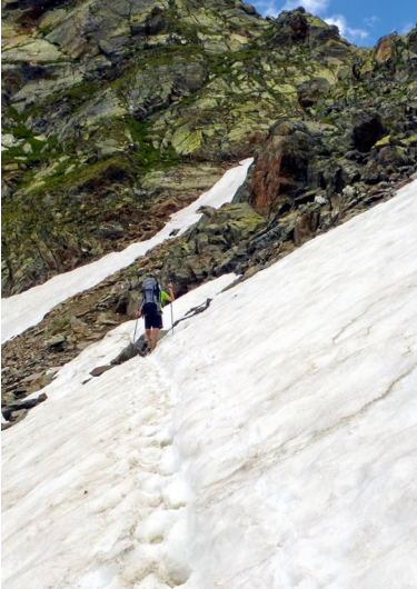
Hinauf zur Windachscharte

Hier könnte man nur sitzen und schauen und schauen und schauen. Aber nach einer ausgiebigen Rast müssen wir weiter, denn das schwierigste Stück Weges steht uns noch bevor.