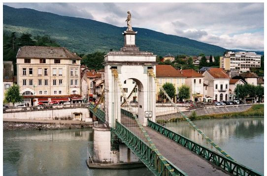
Seyssel - Le vieux pont

Ab Chaumont trennt sich der Hugenottenpfad vom Jakobsweg. Bei Jurens verlasse ich den Hugenottenpfad auf markiertem Weg zur nächsten Bahnstation in Valleiry. Der nächste Halt der Eisenbahn in Richtung Annemasse, Thonon, Evian ist der Grenzort St.-Julien-en-Genevois, von wo aus man mit Bus/Straßenbahn in das Stadtzentrum von Genf fahren kann. Bitte genügend Kleingeld in Schweizer Franken für den Fahrkartenautomaten bereit halten.