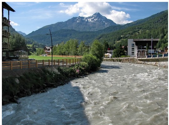
Die Ötztaler Aache

Heute steht der erste Wandertag an von Sölden über das Gasthaus Fiegl hinauf zum Brunnkogelhaus. Erst aber sind noch diverse Besorgungen in Sölden erforderlich. Die Ötztaler Aache rauscht bis an den Rand gefüllt mit hoher Geschwindigkeit durch den Ort, was schon auf viel Schmelzwasser und entsprechender Schneelage weiter oben schließen lässt.