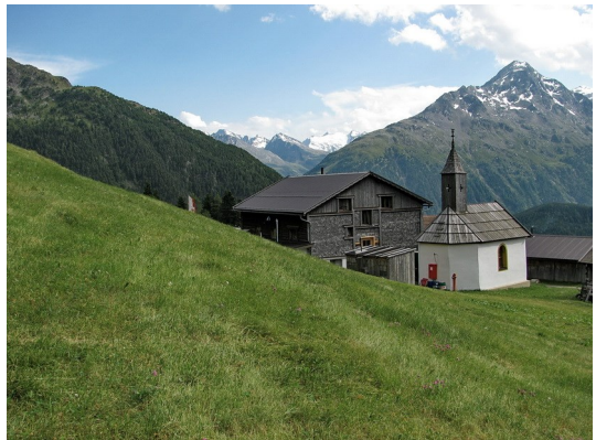
Auf der Kleblealm

Nachdem wir 700 m abgestiegen sind, erreichen wir einen breiten Schotterweg, der uns entlang der Windache talauswärts führt. Unterwegs kommen uns etliche keuchende und verschwitzte Gestalten entgegen, die sich, wie wir herausfinden, auf einem Berglauf befinden. Passend zur Mittagszeit erreichen wir Fiegls Gasthaus und so können wir, wie auf der 1. Etappe wieder auf der Terrasse unter einem Sonnenschirm sitzend, weit in das Windachtal hineinblicken, die wunderschöne Landschaft genießen und uns für das letzte Teilstück unserer Wanderung stärken.