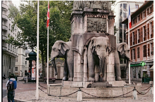
Chambéry - Fontaine des Éléphants

Meine Wanderung umfasste die Abschnitte ab Chambéry bis zur Schweizer Grenze bei Valleiry. Chambéry, die alte Hauptstadt des Königreichs von Piemont-Sardinien begrüßt den Wanderer mit seiner charmanten Altstadt. Am Rathaus erinnert eine Gedenktafel an die „Wiedervereinigung“ von Savoyen mit Frankreich unter Abspaltung vom Königreich Piemont im Zuge der italienischen Einigung im Jahre 1860/1862. Auf den heutigen Plakaten kann man einen Gegentrend erkennen: Sie fordern die Abspaltung von Savoyen von der französischen Republik.