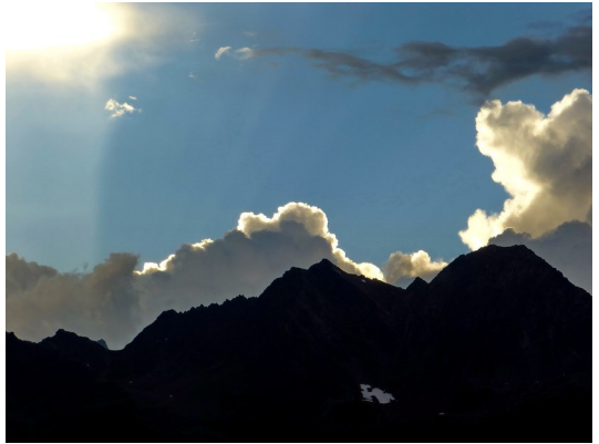
Das Gewitter naht ...

Wir verlassen nun noch einmal das Windachtal und steigen auf der Stubaier Seite über die Windachalm knapp 500 Höhenmeter auf, bis wir an einer Weggabelung den Pfad zur Kleblealm einschlagen. Er führt uns stetig abwärts durch Wiesen und kleine Kiefernwälder mit einem sich immer weiter auf das Öztal öffnenden Blick bis zur Kleblealm (2015 m), die wir am frühen Nachmittag erreichen. Sie ist noch ein richtiges Almdorf mit mehreren Häusern, Stallungen und einem Kirchlein. Es herrscht großer Betrieb, denn das letzte Heu muss ins Trockene, bevor das in der Ferne schon dräuende Gewitter herangezogen ist.