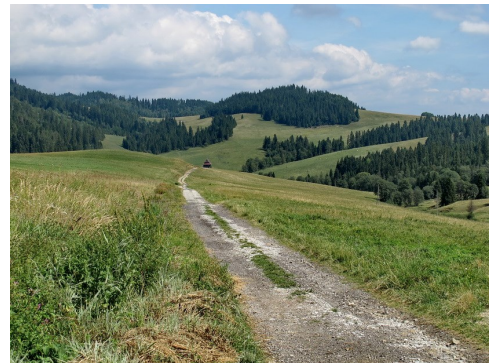
Schäfersiedlung Jurgowkie Stajnie bei Durztyn (Dornstein)

Jetzt begann das übelste Teilstück. Dichtes Buschwerk, Brennesseln,