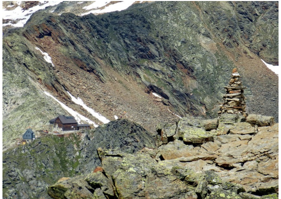
Die Hildesheimer Hütte - so nah und doch noch so fern -

Nachdem die Vorräte vertilgt und die Passfotos gemacht sind, geht es auf der anderen Seite der Scharte ca. 500 m steil ins Gaiskar