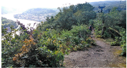
Abstieg nach Boppard

Terrassenwege und man wird bei diesem Weg auch nicht umhin kommen, sich gelegentlich den einen oder anderen Schweißtropfen von der Stirn zu wischen und sich über fast alpin anmutende Auf- und Abstiege zu wundern. Belohnt wird man dann aber immer wieder mit kulturellen Ausgleichen: So sind wir z.B. am Rolandsbogen vom Jakobsweg abgewichen und über die Burgruine Rolandseck – herrliche Aussicht auf der Restaurant-Terrasse! – zum Bahnhof Rolandseck abgestiegen, um dort das Arp-Museum zu besichtigen. Von dort gelangt man wieder problemlos zum Weg zurück (Hinweis RheinBurgenWeg).