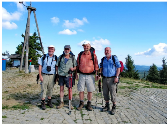
Wandergruppe am Beginn unserer Tour durch die Sandezer Beskiden

Bereits nach wenigen Minuten erreichten wir den Gipfel des Jaworzyna Krynicka mit 1.114 m. Wir hatten die Beskid Niski (Niederer Beskiden) verlassen und befanden uns ab Krynica-Zdrój im Gebirge der Beskid Sądecki (Sandezer Beskiden).