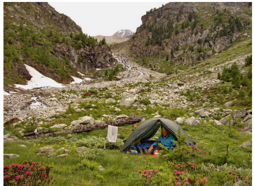
Biwak am Balfrin-Höhenweg

Von Grächen Aufstieg zur Hannigalp 2121 m unterm Regenschirm, in dem Gasthaus ist gut warten auf Wetterbesserung. Normal viel zu spät starten wir um 13.30 Uhr zum gefährdeten auf langen Strecken ausgesetzten Balfrin-Höhenweg in Richtung Saas Fee. Ist kein Problem für uns, wir bewundern die Erbauer. Am Schweib-Bach angekommen nach der Hälfte der 8:10 Std. Gehzeit, stellen wir um 17 Uhr das Zelt auf einen ebenen Flecken Gras.