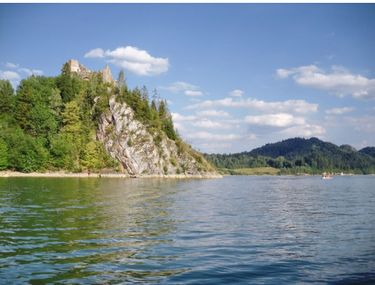
Burg in Czorsztyn (Schauerstein) vom See Jezioro Czorsztanskie)

Um zur Ablegestelle des Fährbootes zu gelangen, mussten wir den Ort durchqueren und eine Burg passieren, die zum Schutz der gegenüberliegenden ungarischen Burg errichtet wurde. Bis zum Ende des Ersten Weltkriegs verlief hier die Grenze zwischen Polen und Ungarn.