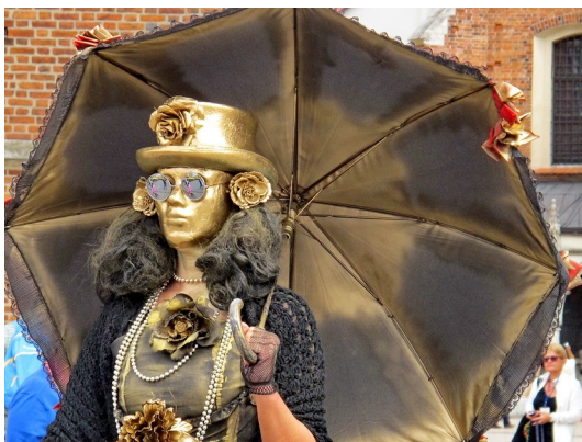
Maskierte Mime auf dem Rynek von Krakau

An der Bushaltestelle konnten wir uns mit goralischem Käse eindecken. Um 14:00 Uhr fuhren wir dank einer vierspurigen Schnellstraße nach etwa 30 km, trotz zweier längerer Staus im engen Tal der Schwarzen Dunajetz und 10 km vor Krakau, in nur 2 ½ Stunden nach Kraków (Krakau). Der Zug hätte wegen des maroden Schienennetzes 4 Stunden gebraucht. Auf der Weichselbrücke mit Blick auf den Wawel wurden Erinnerungen an das letzte Jahr wach.