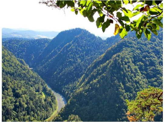
Czertezik -Aussichtspunkt mit Blick in das Dunajec (Dunajetz) -Tal

Vom Czertezik -Aussichtspunkt konnten wir erneut in das Dunajec (Dunajetz) -Tal hinabblicken. Für den steilen Abstieg zurück nach Krościenko nad Dunajcem sind Wanderstöcke zu empfehlen.