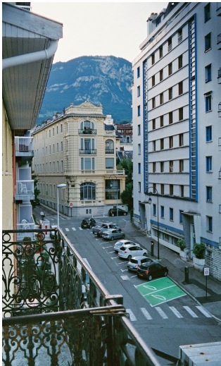
Aix-les-Bains - Stadtansicht

Auf dem Weiterweg aus Aix-les-Bains heraus nehme ich nicht den offiziellen Weg, sondern wandere über die Nebenstraßen D 991, D 48 nach Brison-St.-Innocent. Dort treffe ich auf den markierten Wanderweg mit gelbem Balken auf grünem Grund, der sich hier in mehrere lokale Wege zerteilt. Die Wegebeschreibung stimmt im Ort nicht mit dem markierten Weg überein. Die Markierung wird erst nach ca. 1 km erreicht. Die Übersichtskarte ist hier nicht ausreichend. Die Wanderwegmarkierungen werden teilweise durch Radwegmarkierungen überlagert. Zum Auffinden der Abzweigung von der D 991 B wäre eine Entfernungs- oder Zeitangabe hilfreich.