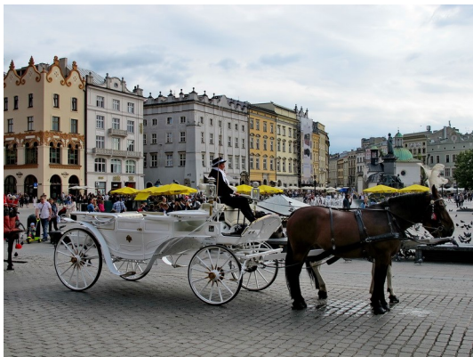
Pferdekutsche auf dem Rynek von Krakau

Bummel erneut zum Rynek, wo wir wieder mit zahlreichen Attraktionen unterhalten wurden. Besonders attraktiv fanden wir die eleganten von ebenso vielen Damen wie Herren gelenkten Kutschen, den Trompeter von der Marienkirche und die zahlreichen maskierten Mimen, die sich wie ihre Pendants im Karneval von Venedig, gerne von und mit den faszinierten Zuschauern fotografieren ließen.