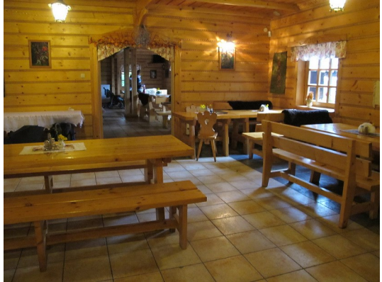
Koliba in Czorsztyn (Schauerstein)

Ein Ausstellungspavillon am Ortsrand von Czorsztyn (Schauerstein) war die erste Gelegenheit sich vor dem Regen unterzustellen. Zum Glück war in der Nähe eine Koliba, wo uns eine heiße Hühnersuppe (aber ohne Hühnerfleisch) aufwärmte.