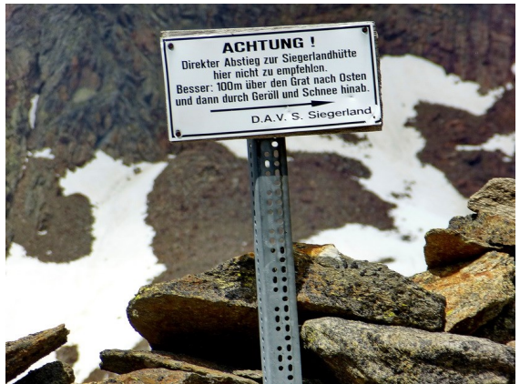
Dieser Hinweis hat die Sache auch nicht leichter gemacht

Das mit dem Abstieg ist allerdings leichter gesagt als getan. Schneefelder und vom Schmelzwasser durchnässter rutschiger Schotter wechseln sich in steilem Gelände ab. Eine Wegspur ist nur rudimentär hin und wieder zu erkennen, so dass man immer wieder auf seifigem Untergrund abzurutschen und zu stürzen droht. Ein Mal haut's mich auch hin, aber bis auf einige Abschürfungen bleibt alles heil und so sind wir doch recht froh, als wir 400 Höhenmeter weiter unten wieder auf festeren Boden gelangen. Nun heißt es noch einmal auf 2710 m zur Siegerlandhütte aufzusteigen, was allerdings, von der Querung einiger durch die Schneeschmelze doch ganz schön breit gewordener Bäche abgesehen, unsvwierig ist.