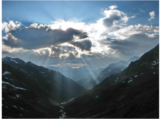
Abendstimmung an der Siegerlandhütte

Auf der Hütte erzählt man uns dann zum Trost, dass die Wege heuer besonders schwierig seien, da seit 30 Jahren hier nicht mehr so viel Schnee gelegen habe. Heute bleibt das tägliche Gewitter aus und nach dem Abendessen gibt es sogar noch Sonne auf der Hüttenterrasse mit einem phantastischen Rundblick auf die Gletscherregionen von Schwarzwandspitze, Sonklarspitze, Wilder Pfaff und Zuckerhütl.