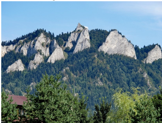
Der Trzy Korony (Drei-Kronen-Berg) vom Fluß Dunajetz aus gesehen

Zum Betreten des Gipfels muss man eine Gebühr entrichten. Über stählerne Treppen und Leitern und Gänge – getrennt für Auf- und Abstiege – erreichten wir in wenigen Minuten den Gipfel. Auf der Aussichtskanzel auf einer Höhe von 982 m drängten sich die Besucher, so dass wir nach wenigen Fotos das Weite suchten.