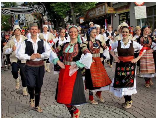
Folklorefestspiele aus Kroatien