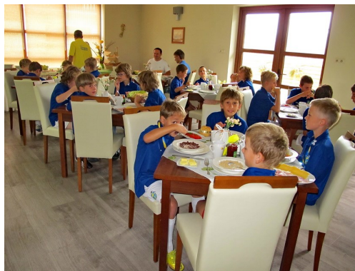
Junge polnische Fußballspieler

Die 20 talentiertesten Fußballspieler im Alter von 8 bis 10 Jahren aus der Stadt Tarnów (Tarnau) hatten in unserer Pension ihr Quartier aufgeschlagen. Ein vielstimmiger Knabenchor begrüßte uns jeden Morgen zum Frühstück mit einem „Guten Morgen“ gefolgt von einem „Guten Appetit“. Besonders „Polonia“ Dortmund war bei den Jugendlichen sehr beliebt und alle wollten ihrem großen Vorbild Robert Lewandowski nacheifern. Krościenko nad Dunajcem mit seinen