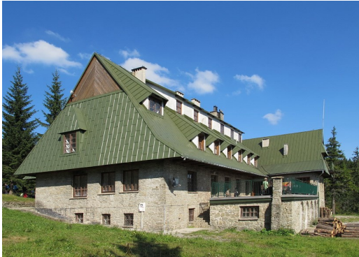
Die Bergbaude Schronisko na Przehybie

Unsere Mittagspause machten wir kurz vor dem Abstieg auf den 830 m hohen Sattel Przysłop przełęcz. Auch hier hatten wir klare Sicht auf die umliegenden Dörfer im Talbecken. Am Pass Przysłop przełęcz war die Heuernte an einem kleinen Weiler mit einigen Schafen und Kühen gerade im Gange. Erneut