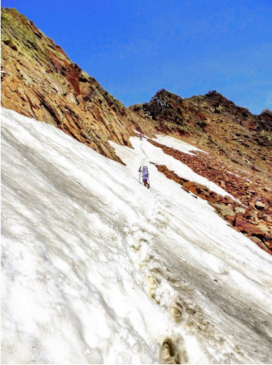
Aufstieg zum Gamsplatzl

bergab, wieder über Schotter, Geröll und Schneefelder. Glücklicherweise ist der Abstieg diesmal aber wesentlich einfacher als gestern, etwas Grünes bekommt das Auge allerdings auch auf dieser Seite des Passes nicht zu sehen. Am tiefsten Punkt angekommen müssen wir noch einmal einen breiten Schmelzwasserbach aus dem Pfaffenferner überqueren, aber diesmal ist ein Steg vorhanden, auf dem wir trockenen Fußes auf die andere Seite gelangen. Nun heißt es noch einmal die letzten Kräfte zu mobilisieren und über mehrere Felsstufen steil hinauf zur Hildesheimer Hütte (2900m) aufzusteigen.