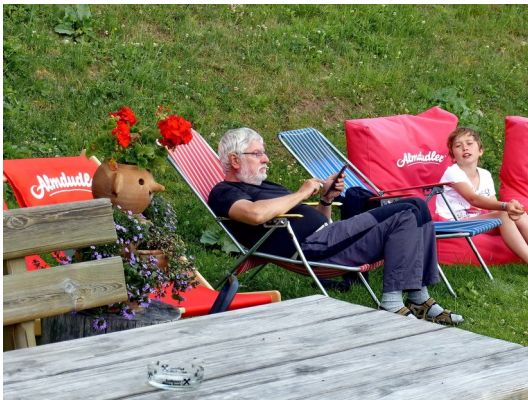
... aber noch sitzen wir in der Sonne

Trotzdem bekommen wir erst mal auf Kosten des Hauses einen Begrüßungsschnaps und können es uns dann in den auf der Wiese aufgestellten Liegestühlen bequem machen.