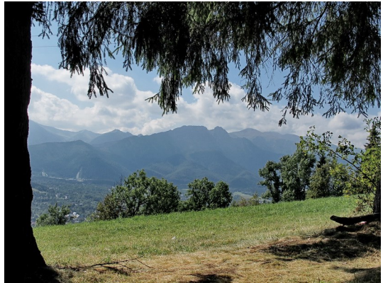
Blick auf das Massiv der Hohen Tatra

Mit der kolej linowa (Bergbahn) fuhren wir in wenigen Minuten auf den 1.120 m hohen Gubałówka, der von unserem Hotel aus gut am Sendemast zu erkennen war. Trotz des schönen Wetters war die Aussicht auf die Tatra-Riesen eingeschränkt, es war zu diesig. Hier oben reihten sich Souvenirläden an Souvenirläden. Erinnerungen an die Fidschimärkte an der tschechischen Grenze wurden wach. Angeboten wurden u.a. goralische Pantoffeln, Decken, geräucherter Käse (Oszczypek), Kinderspielzeug, Eis.