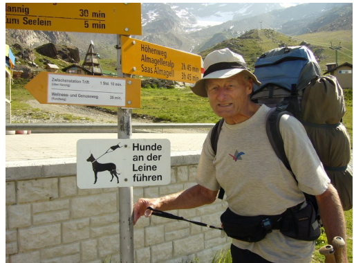
„Muss der Diem an die Leine?“

Wären wir nur weiter gegangen, denn am nächsten Morgen ist Sturm und Regen, keine Chance auf dem ausgesetzten Steig nach Saas Fee. Es bietet sich der Notabstieg an am Schweib-Bach entlang ins Tal. Am Weg liegt die Alpe Schweiben, die hat eine kleine neue Luftseilbahn hinab nach Tann. Und dazu einen Mann auf der Alpe, der uns die Bahnfahrt anbietet und die offene Gondel in Gang setzt. Unten angekommen fährt uns auch gleich ein Linienbus nach Saas Grund, und schon sitzen wir hoch erfreut in einem Café zum 2. Frühstück. Gerettet, draußen regnet es heftig. Busfahrt nach Saas Fee zum Dorfbummel, Übernachtung im Hotel Bergheimat, und am nächsten Morgen ist schönes Wetter, juhu.