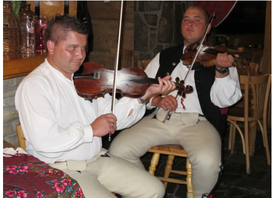
Goralenmusiker im Koliba-Restaurant „Bąkowa Zohylina“

Zakopane erschreckt die Besucher aufgrund der großen Menschenmassen auf der Ulica Krupówki – der Fußgängerzone. Unser Abendessen nahmen wir im Koliba-Restaurant „Bąkowa Zohylina“ ein, das nur wenige Meter von unserm Hotel entfernt lag. Unterhalten wurden wir von einer 4-Mann Kapelle (3 Geigen und ein Kontrabass) mit Goralenmusik.