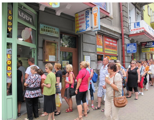
Gedränge vor einer Eisdiele

Wir haben schon viele Kurorte in Polen gesehen, aber noch keinen mit so vielen Besuchern. Krynica-Zdrój scheint der populärste in Polen zu sein.