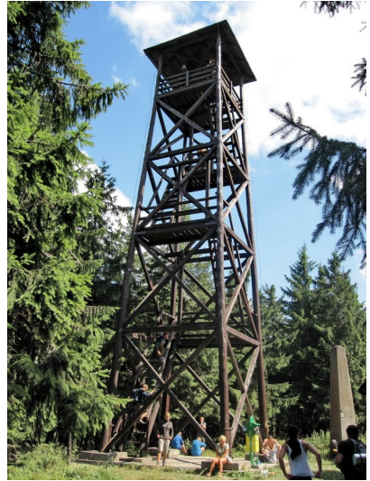
Hölzerner Aussichtsturm Radziejowa auf 1.255 m

Ein steiler, anstrengend zu wandernder Geröllpfad führte zum Aussichtsturm Radziejowa 1.255 m. Der hölzerne Turm ist wegen seiner außergewöhnlichen Aussicht ein „Highlight“ auf dieser Wanderetappe. Vom Aussichtsturm gingen wir, wie die meisten Wanderer, zur Schronisko na Przehybie und reihten uns in die lange Schlange vor der Getränke- und Essensausgabe ein.